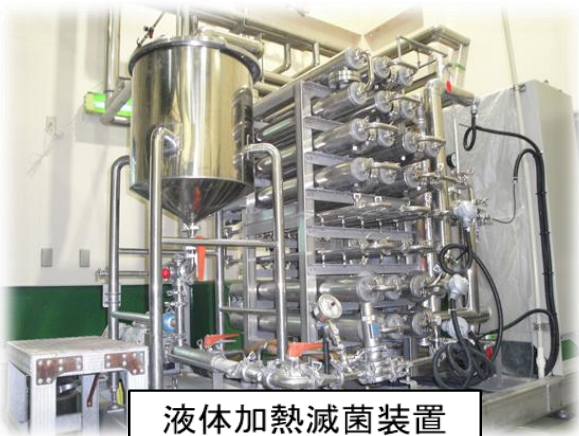
液体加熱滅菌装置